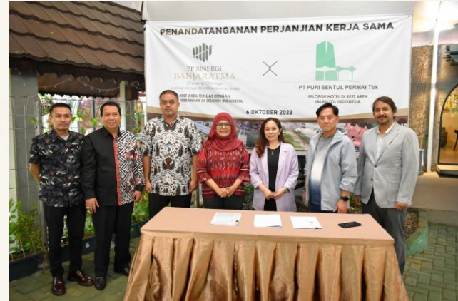
Penandatanganan Perjanjian Kerjasama Hotel & Fasilitasnya di Rest Area Km. 260B dengan PP Sinergi Banjaratma