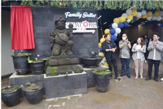
Peresmian 2 (dua) unit Kamar Family Suite 27 Februari 2023