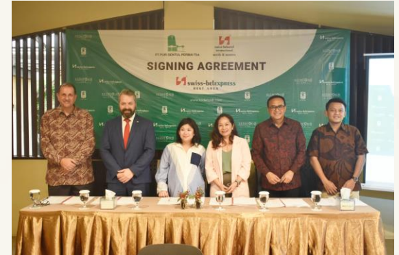
27 Juni 2023