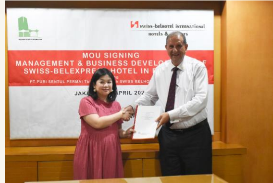
18 April 2023