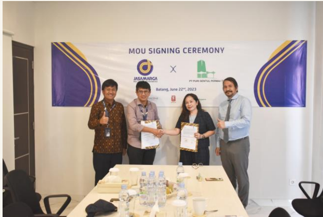
Penandatanganan MOU dengan JMRB untuk Fasilitas Inap di Km. 379A